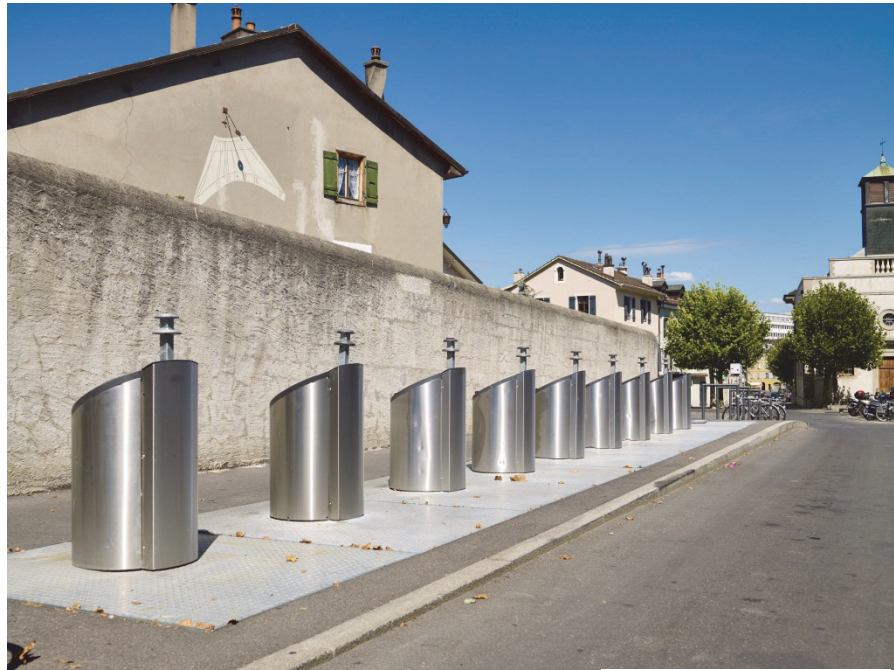
Photographie Laurent Perez