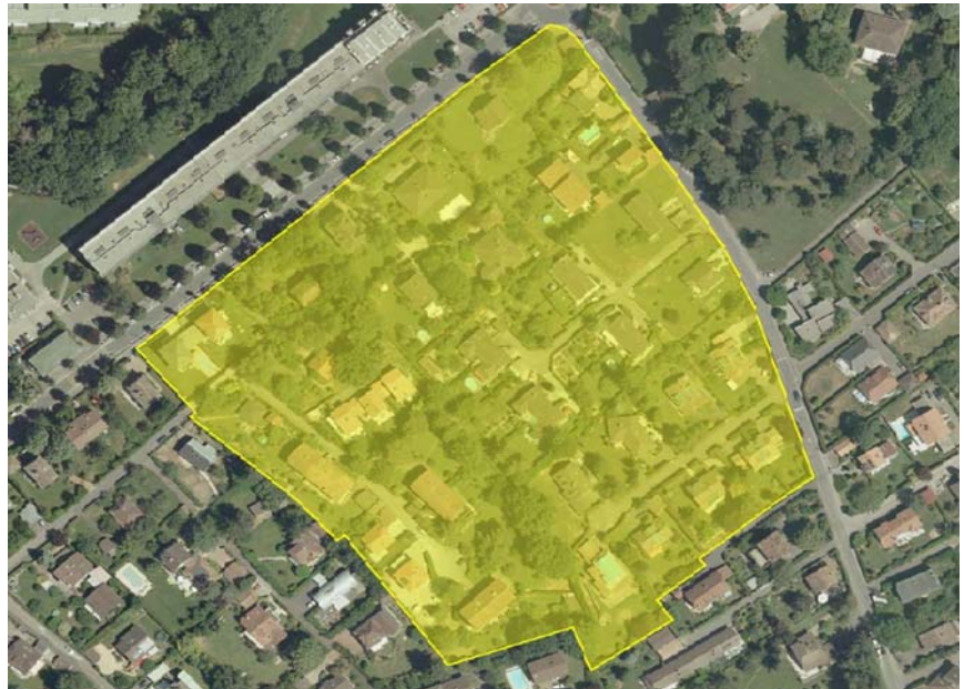
Illustration : périmètre de prospection