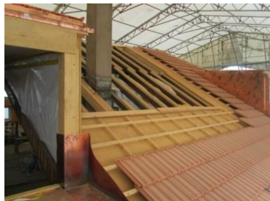
Illustration : réhabilitation de la toiture