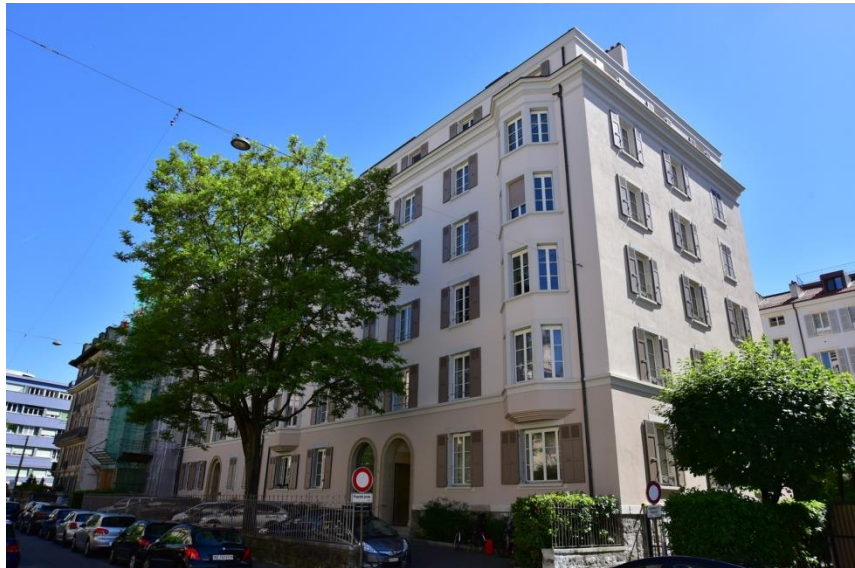
Illustration : Façade