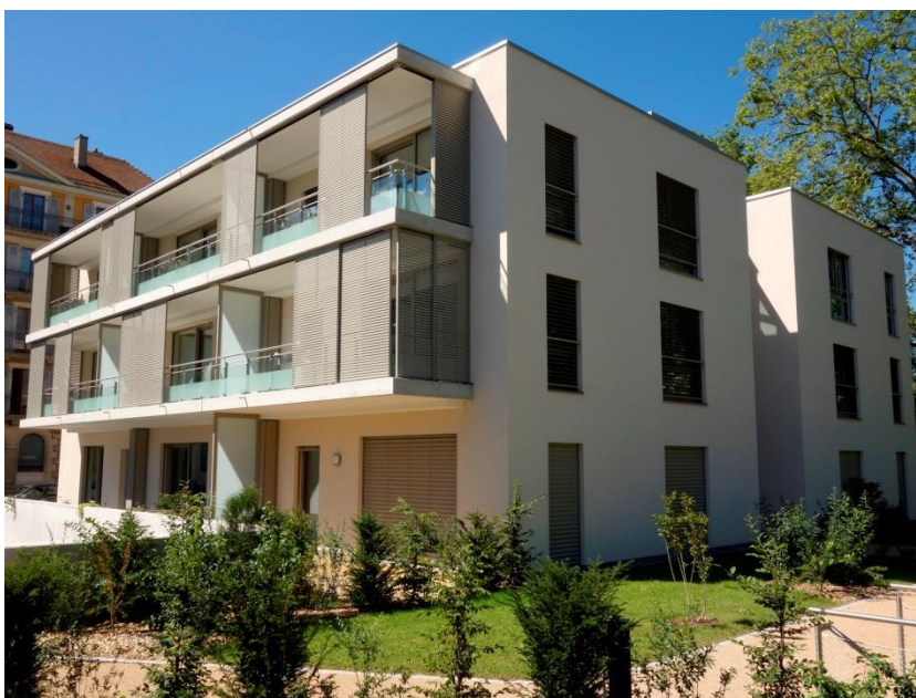
Illustration : Façades