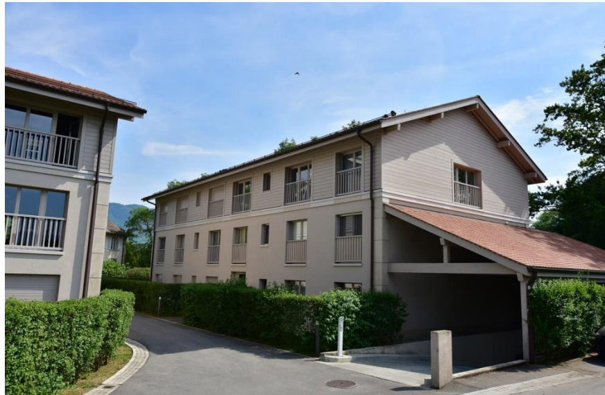
Illustration : Façade