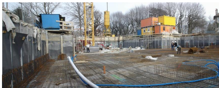
Illustration: ferrailage du radier