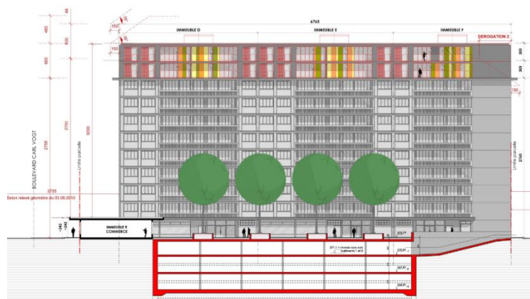
Illustration: coupe/élévation du projet

Expertise générale de la structure, vérification sismique des bâtiments, estimation de la résistance au feu des structures, contrôle de la carbonatation des façades, étude amiante, etc. Réalisation d'un parking souterrain de 3 niveaux sous les bâtiments existants. Mise en séparatif de l'ensemble des immeubles.