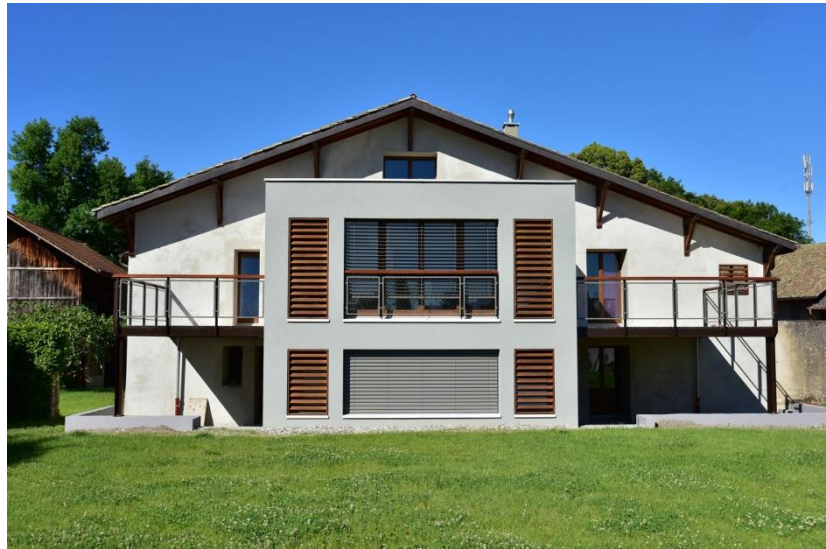
Illustration : Façade