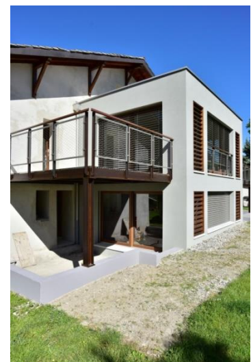
Illustration : extension